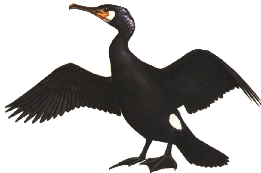
Kormoran –Vogel des Jahres 2010